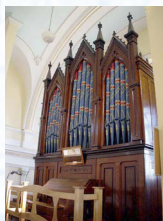
L'orgue avant et après sa restauration